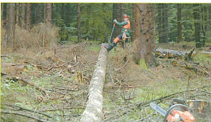
Figuur 2: Boomstammen omdraaien tijdens het onttakken is een klassieke toepassing van de kantelhaak. Hier wordt een half onttakte fijnspar gedraaid.

Tot slot nog een toepassing van de kantelhaak die je veel plezier zal opleveren bij het doorzagen van boomstammen. Dikke stammen moet je, als het zaagblad te kort is, kantelen om er volledig door te geraken. Het lijkt op het eerste zicht onnodig om dunne stammen te draaien, maar het voordeel is dat je daardoor zeker niet in de grond zaagt en je zaagketting lang scherp blijft.