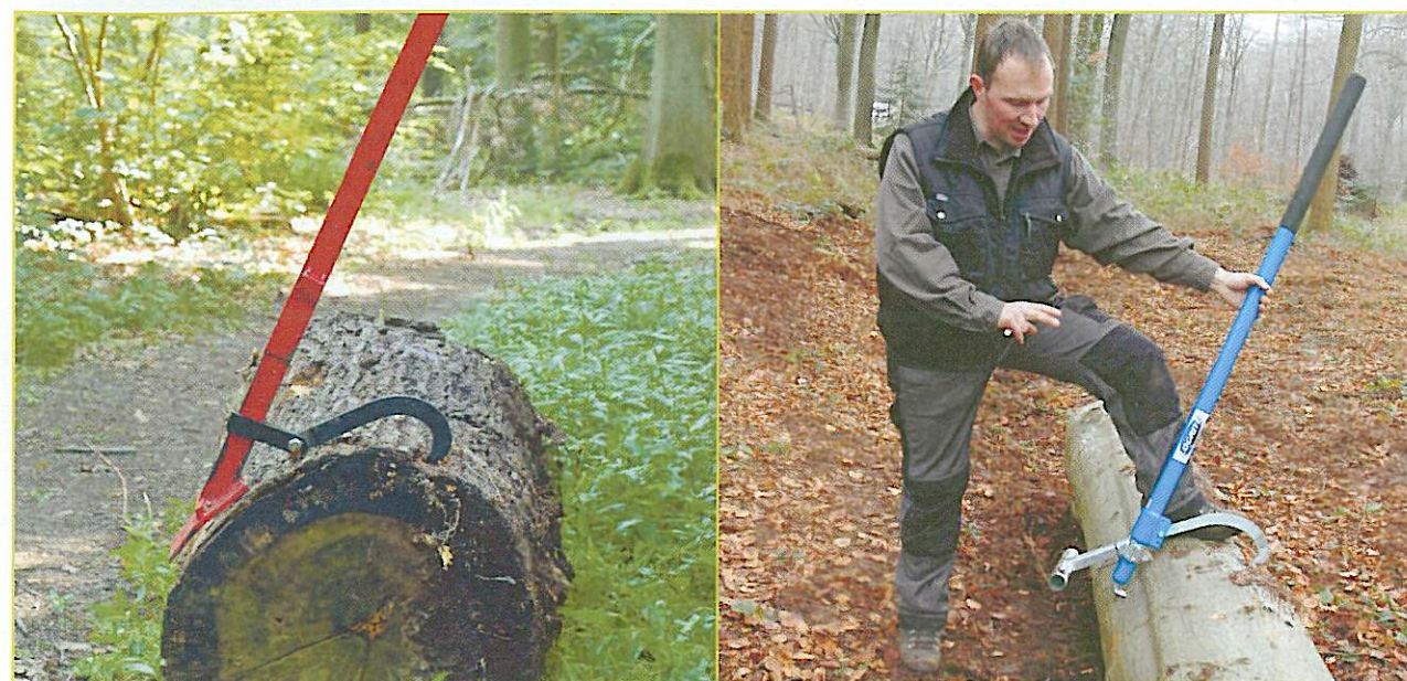
Figuur 3: Gecombineerde velhevels/kantelhaken (links) hebben als voornaamste nadeel dat de kantelhaak zich dikwijls niet goed in het hout vastbijt. Op dat vlak werken enkelvoudige kantelhaken (rechts) stukken beter.

De methode werkt als volgt: inzagen van de boomstam tot een stukje boven de grond, de boomstam een halve toer draaien met de kantelhaak en het laatste stukje doorzagen. Als je dat doet met een duwende ketting, kan je het makkelijkst doorgaan op de ingezette zaagsnede.